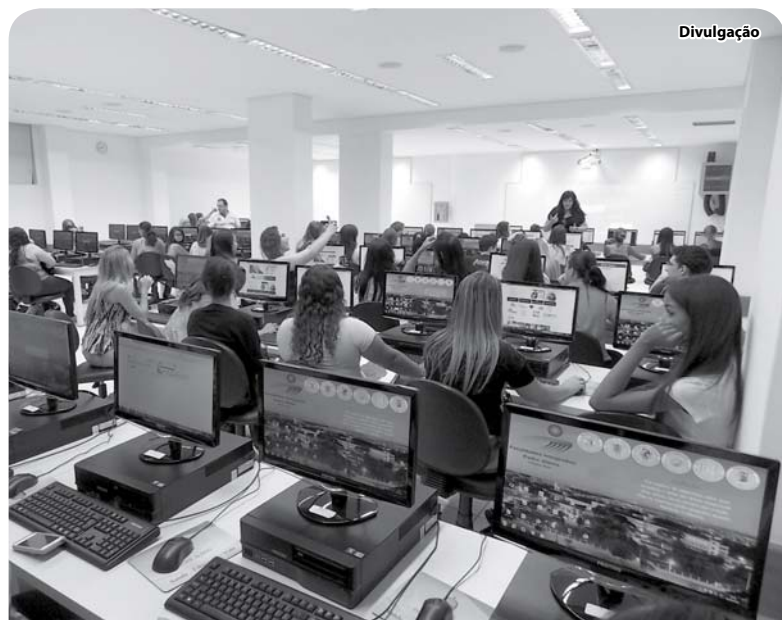
Alunos no Laboratório de Informática III do Câmpus Sede.

Os aprovados fizeram matrícula nos dias 16 e 17 e as aulas foram iniciadas dia 18. O cursinho, totalmente gratuito, funciona no Câmpus Sede das FIPA. Os professores são todos acadêmicos de Medicina e trabalham como voluntários no projeto. O projeto, em atividade há 11 anos, é uma parceria entre o curso de Medicina, as FIPA, o Centro Acadêmico Emílio Ribas, a Fundação Padre Albino e a Secretaria de Educação de Catanduva.