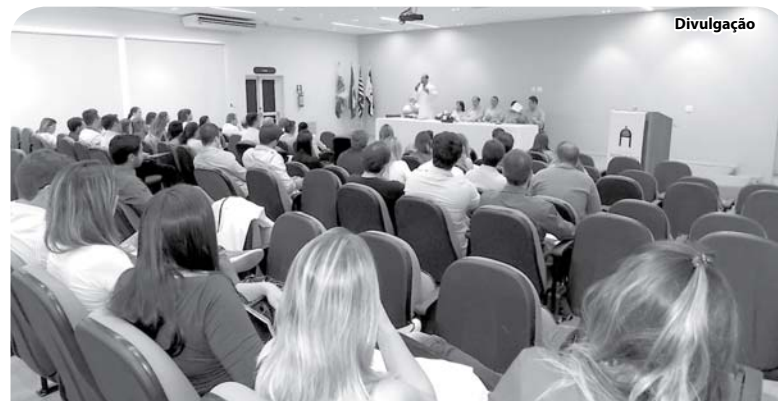
Os Residentes vieram de vários Estados do Brasil.

Os novos residentes foram recepcionados pela COREME e pelo Grupo de Trabalho de Humanização dos Hospitais da Fundação Padre Albino.