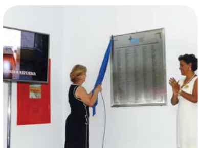
Descerramento da placa dos homenageados.