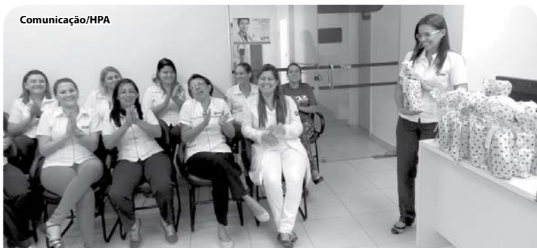
Confraternização interna no PAS presta homenagem às mulheres.

O plano de saúde também realizou confraternização, no dia 06 de março, no período da tarde, em sua sede, para homenagear as colaboradoras. As profissionais receberam um mimo e uma mensagem comemorativa.