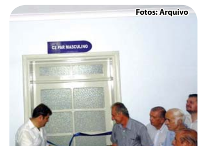
Corte da fita inaugural.