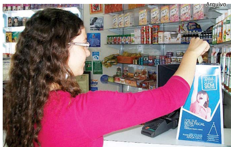
O apoio do comércio e, principalmente, da população é refletido em benfeitorias para os hospitais.

A 3ª edição da Conjuntura de Catanduva foi lançada dia 8 de agosto último. O lançamento teve a participação de alunos do curso de Administração das FIPA, técnicos do IBGE e de autoridades municipais. A partir do ano que vem, a FAECA Júnior assume esse projeto. Última página.