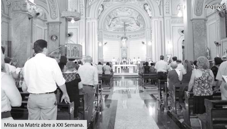
Missa na Matriz abre a XXI Semana.