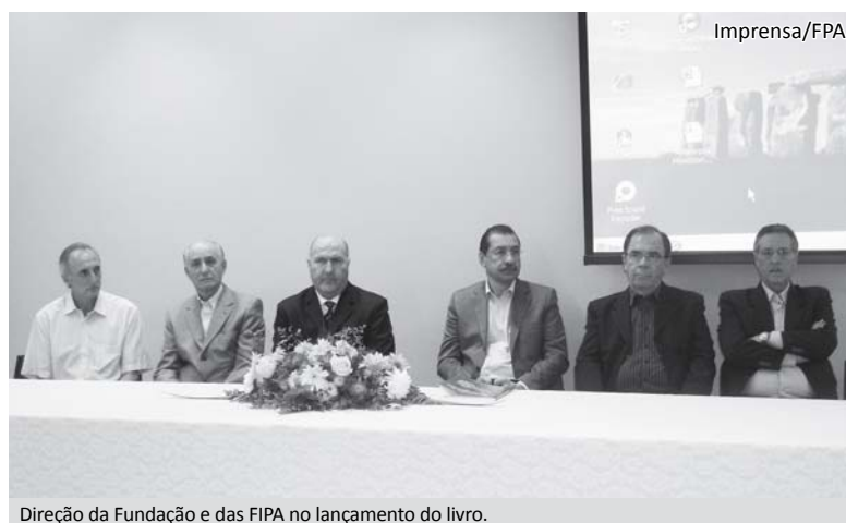
Direção da Fundação e das FIPA no lançamento do livro.