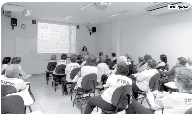
O curso é de caráter informativo e oferece aos alunos palestras e atividades físicas e de lazer.

Os interessados podem obter mais informações no Câmpus Sede das FIPA, na Rua dos Estudantes, 225, Parque Iracema (Hospital Emílio Carlos), fone (17) 3522-3373, nos períodos da tarde e noite.