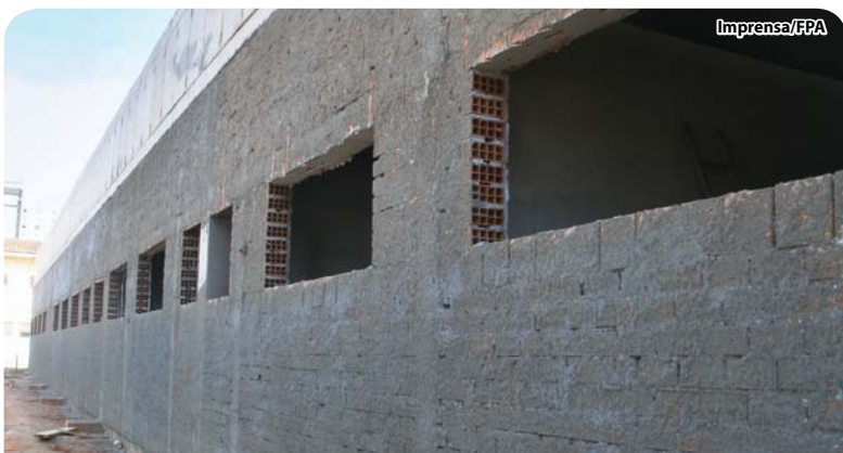
A fase de alvenaria está encerrada.

O Diário Oficial do Estado do dia 19 de agosto publicou Extrato de Convênio liberando verba de R$ 1.727.546,47 para a Fundação Padre Albino/Hospital Emilio Carlos concluir o Serviço de Radioterapia.