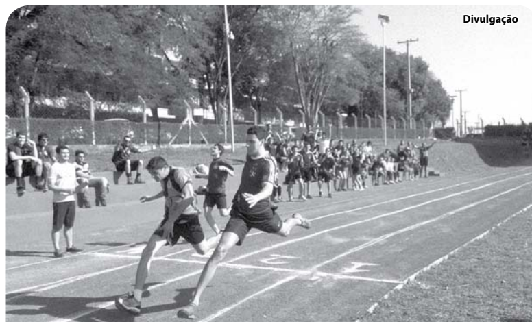
Os jogos foram disputados no novo complexo esportivo do Câmpus Sede das FIPA.

bol, handebol, tênis de mesa, xadrez e atletismo (50 metros, salto à distância e arremesso de peso). Após a final dos jogos foi realizada a premiação das equipes vencedoras, que foram as seguintes: 1ª colocada: 4º Bacharelado (122 pontos); 2ª colocada: 3º Licenciatura (118 pontos); 3ª colocada: 1º B Licenciatura (96 pontos); 4ª colocada: 1º A Licenciatura (84 pontos); 5ª colocada: 2º Licenciatura (78 pontos) e 6ª colocada: 1º Bacharelado (42 pontos).