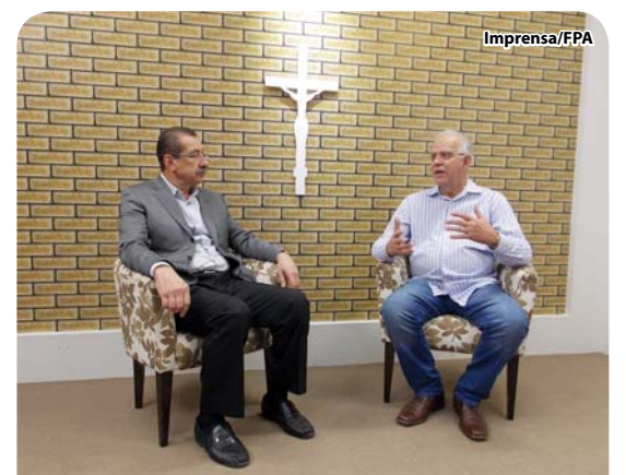
A atuação da Fundação na área da saúde foi o tema da entrevista.

TELHADO A Fundação Padre Albino concluiu mais uma etapa na recuperação do prédio do Hospital Emilio Carlos. Depois da pintura, gradativamente vem trocando telhas, ripamento, rufos, calhas e condutores. A última etapa consumiu 30 mil telhas, a um custo de R$ 135 mil (material e mão de obra). Falta somente a troca das telhas do corredor central, que liga o HEC às FIPA.