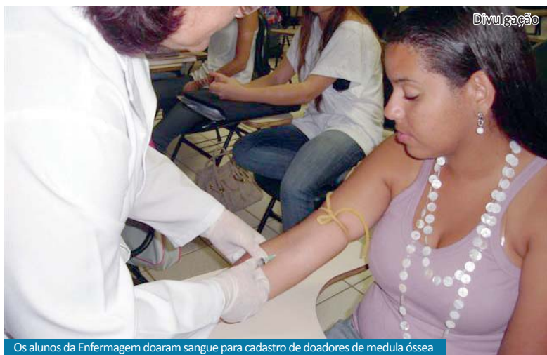
Os alunos da Enfermagem doaram sangue para cadastro de doadores de medula óssea

As Faculdades Integradas Padre Albino (FIPA) iniciaram as aulas para os primeiros anos nos dias 7 e 14 de fevereiro. A exemplo do ano passado, as FIPA realizaram nos dois campi uma campanha contra o trote com a fixação de cartazes e banners. Página 06.