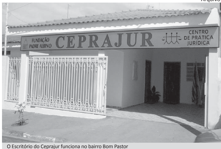
O Escritório do Ceprajur funciona no bairro Bom Pastor

O Centro de Prática Jurídica (CEPRAJUR) do curso de Direito das FIPA realizou, no ano de 2010, 207 atendimentos gratuitos a pessoas carentes em seu escritório de assistência jurídica.