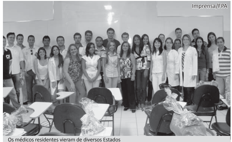
Os médicos residentes vieram de diversos Estados