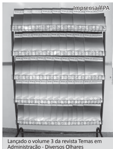
Lançado o volume 3 da revista Temas em Administração - Diversos Olhares

Após a palestra foi lançado o volume 3, número 1, Janeiro/Dezembro/2010 da revista Temas em Administração – Diversos Olhares .