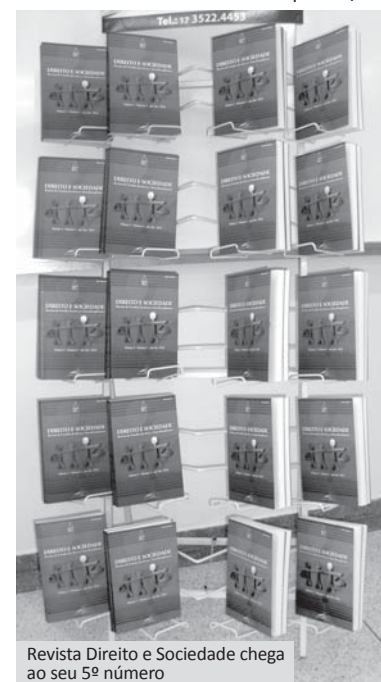
Revista Direito e Sociedade chega ao seu 5º número