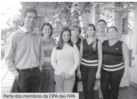
Parte dos membros da CIPA das FIPA