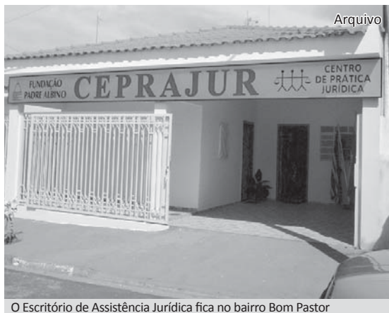
O Escritório de Assistência Jurídica fica no bairro Bom Pastor

As Faculdades Integradas Padre Albino, desde 2009, vêm disponibilizando bolsas de estudos para alunos do curso de Direito que fazem estágio no Centro de Prática Jurídica – CEPRAJUR. Nesse ano de 2010, pelo grande número de alunos interessados nas três bolsas oferecidas, a Coordenação do CEPRAJUR e a Coordenação do curso buscaram de uma forma justa e democrática distribuir as bolsas por meio de um processo seletivo.