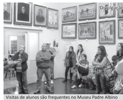
Visitas de alunos s o frequentes no Museu Padre Albino

O Museu Padre Albino, na Rua Bel m, 647, esquina com Rua Cear , funciona de 2  a 6  feira, das 7h00  s 17h00, e aos s bados, das 7h00  s 11h00. As visitas podem ser agendadas pelo fone (17) 3522.4321. A entrada   franca.