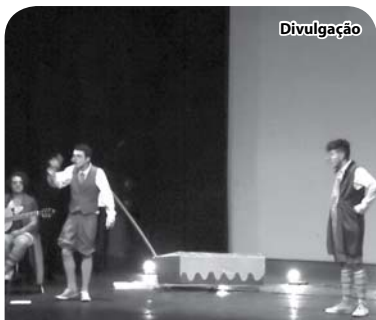
Apresentação do grupo Mensageiros do vento.

As sessões são abertas ao público e gratuitas e ao final há debate com diferentes docentes e profissionais de cinema.