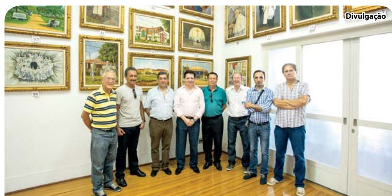
Autoridades portuguesas e catanduvenses no Museu Padre Albino.

No dia 31 de janeiro, cumprindo programação oficial elaborada pela Prefeitura de Catanduva, autoridades da cidade de Celorico de Basto, Portugal, visitaram o Museu Padre Albino. Os portugueses vieram assinar protocolo de intenções que tornaram Catanduva e Celorico de Basto "Cidades Irmãs". Última página.