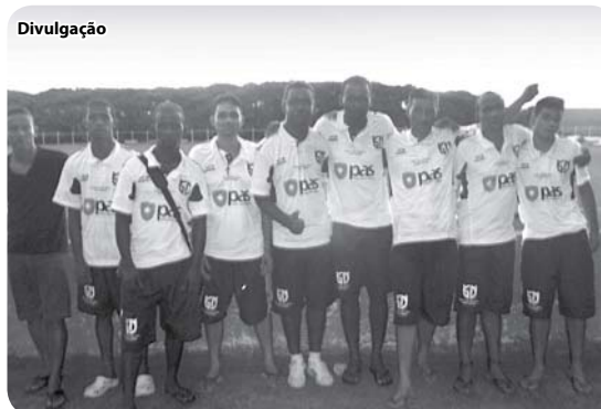
A equipe patrocinada pelo PAS

Para o plano, apesar de simbólico, o auxílio reforça a preocupação com a promoção de saúde dos beneficiários e de mais indivíduos.