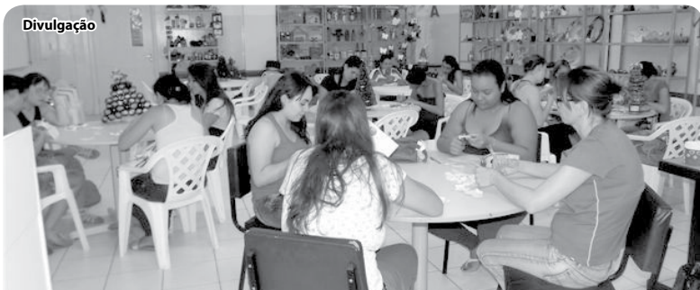
Alunos constroem materiais e suportes para a contação de histórias

Dia 30 de março, no Câmpus Sede, o curso de Pedagogia das FIPA iniciou as atividades dos projetos de extensão de 2014.