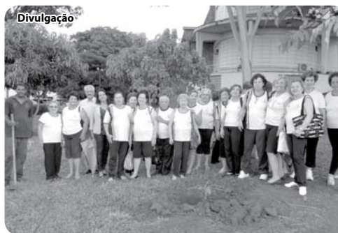
A árvore vai simbolizar a turma

Dia 20 de março, as alunas da Faculdade da Terceira Idade, programa oferecido pelo curso de Educação Física das FIPA, plantaram duas árvores no jardim do Câmpus Sede para simbolizar a turma, como já é tradição em outros cursos.