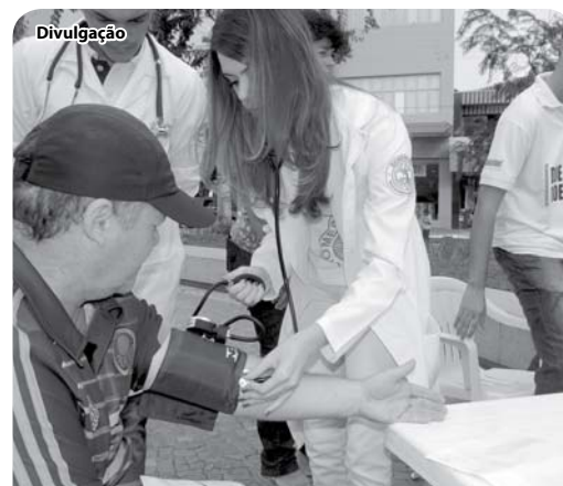
O objetivo foi informar ao cidadão sobre cuidados básicos de saúde

laboratórios de Anatomia, Parasitologia, Microbiologia, Fisiologia e Habilidades e Emergências Médicas e o Museu de Patologia apresentados pelos técnicos responsáveis de cada laboratório. No dia 10, o Câmpus Sede recebeu a visita de alunos do curso Técnico em Farmácia do CEME.