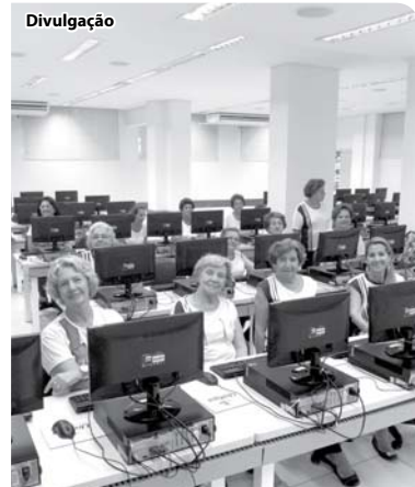
O primeiro contato com o computador

As alunas tiveram o primeiro contato com o computador e no decorrer das aulas aprenderão as principais ferramentas básicas da informática, entre elas, o acesso a internet e às redes sociais.