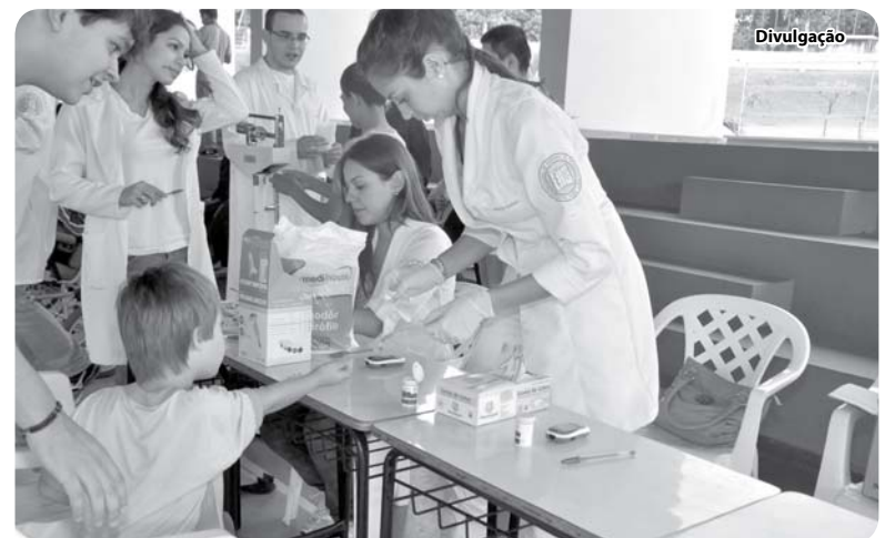
Dosagem de glicemia foi um dos exames realizados no dia

Os cursos de Medicina e Educação Física das FIPA, em parceria com a IFMSA Brazil, realizaram na APAE de Catanduva, dia 21 de março, atividades comemorativas ao Dia Internacional da Síndrome de Down, cuja campanha, neste ano, teve o slogan "Saúde e bem-estar – Acesso e igualdade para todos".