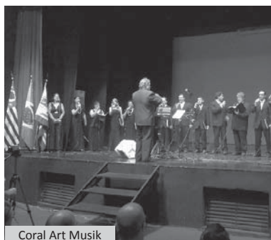
Coral Art Musik