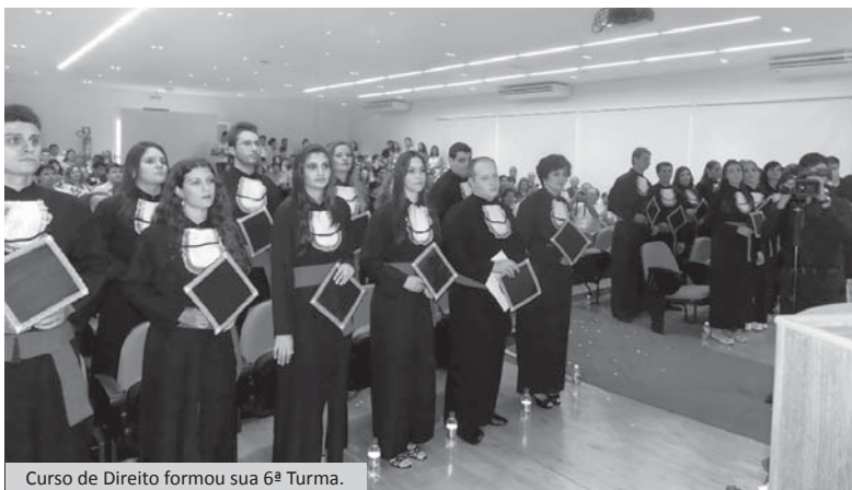
Curso de Direito formou sua 6ª Turma.