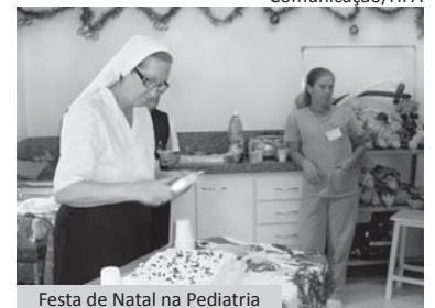
Festa de Natal na Pediatria

Dia 19 de dezembro foi realizada a comemoração de Natal na Pediatria do Hospital Padre Albino. Na ocasião houve entretenimento e entrega de brindes com os integrantes do Projeto Dr. Sara & Cura, mantido pelos Rotaryst Clubs.