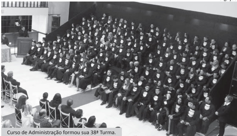
Curso de Administração formou sua 38ª Turma.