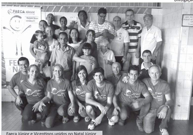
Faeca Júnior e Vicentinos unidos no Natal Júnior

As comemorações natalinas terminaram com o almoço de Natal, no dia 25 de dezembro.