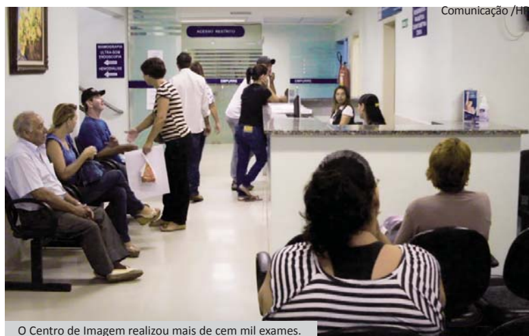
O Centro de Imagem realizou mais de cem mil exames.

Os hospitais Padre Albino e Emílio Carlos atenderam 193.644 pacientes em 2012, entre internações, atendimentos ambulatoriais e de urgência e emergência. Página 07.