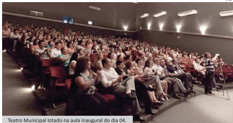
Teatro Municipal lotado na aula inaugural do dia 04.

As Faculdades Integradas Padre Albino (FIPA), através do Núcleo de Apoio ao Estudante (NAE), promoveram aulas inaugurais para recepcionar os alunos ingressantes de 2013 dos cursos de Administração, Biomedicina, Direito, Educação Física (Bacharelado e Licenciatura), Enfermagem, Medicina e Pedagogia nos dias 04 e 18 de fevereiro. Página 08.