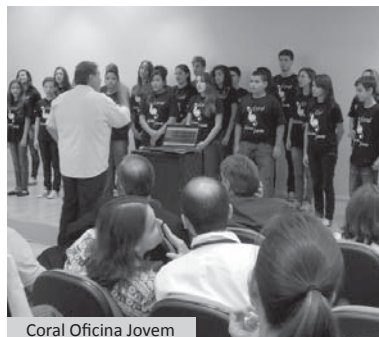
Coral Oficina Jovem