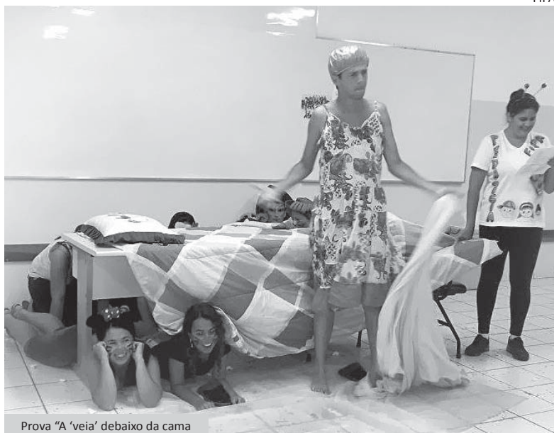
Prova "A 'veia' debaixo da cama"