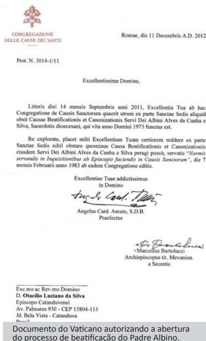
Documento do Vaticano autorizando a abertura do processo de beatificação do Padre Albino.

Dia 05 de março próximo, às 20 horas, na Matriz de São Domingos, será realizada a cerimônia jurídico-canônica de abertura do Processo de Beatificação do Padre Albino, com instalação do Tribunal da Causa.