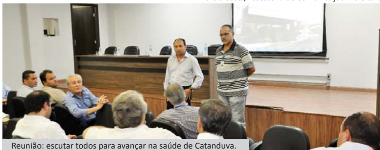
Reunião: escutar todos para avançar na saúde de Catanduva.