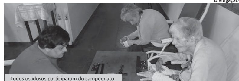
Todos os idosos participaram do campeonato

No período de 11 a 22 de janeiro último foi realizado no Recanto Monsenhor Albino o 3º Campeonato de Dominó.