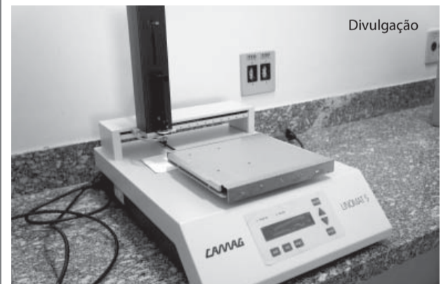
O aparelho também será usado para projetos na linha de fitoterápicos.