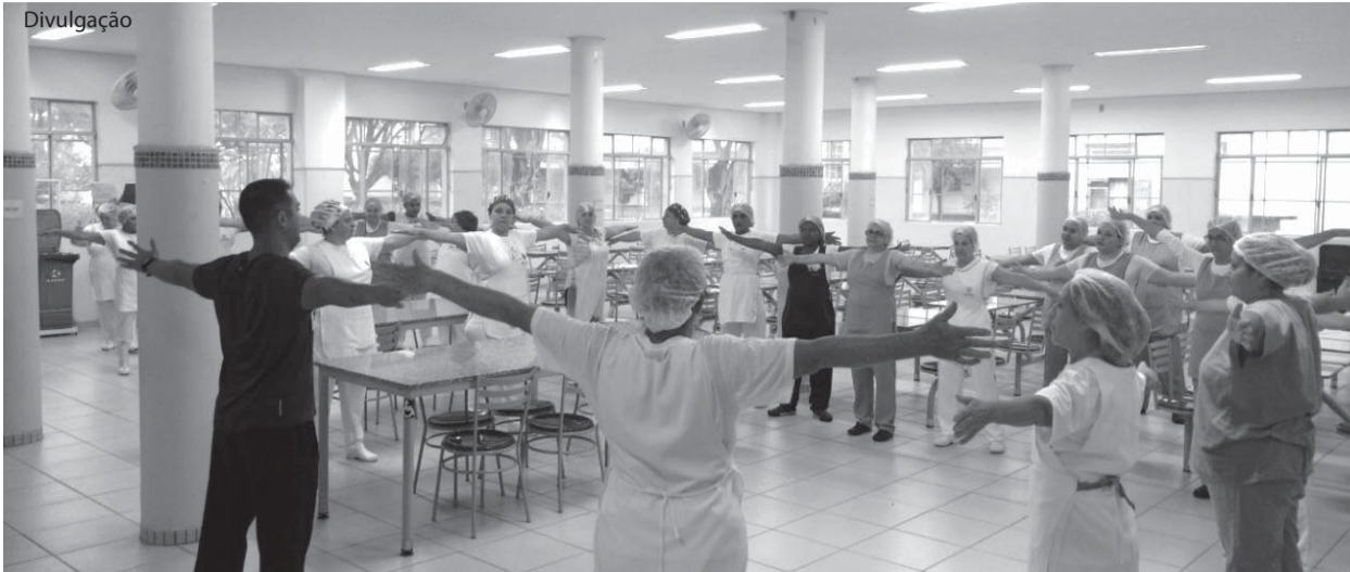
O educador físico já iniciou a ginástica laboral.

Ação integrante do Planejamento Estratégico de 2017, a Fundação Padre Albino relançou dia 28 de novembro o Grupo de Apoio ao Trabalhador (GAT), implantado pelo setor de Recursos Humanos em 2007.