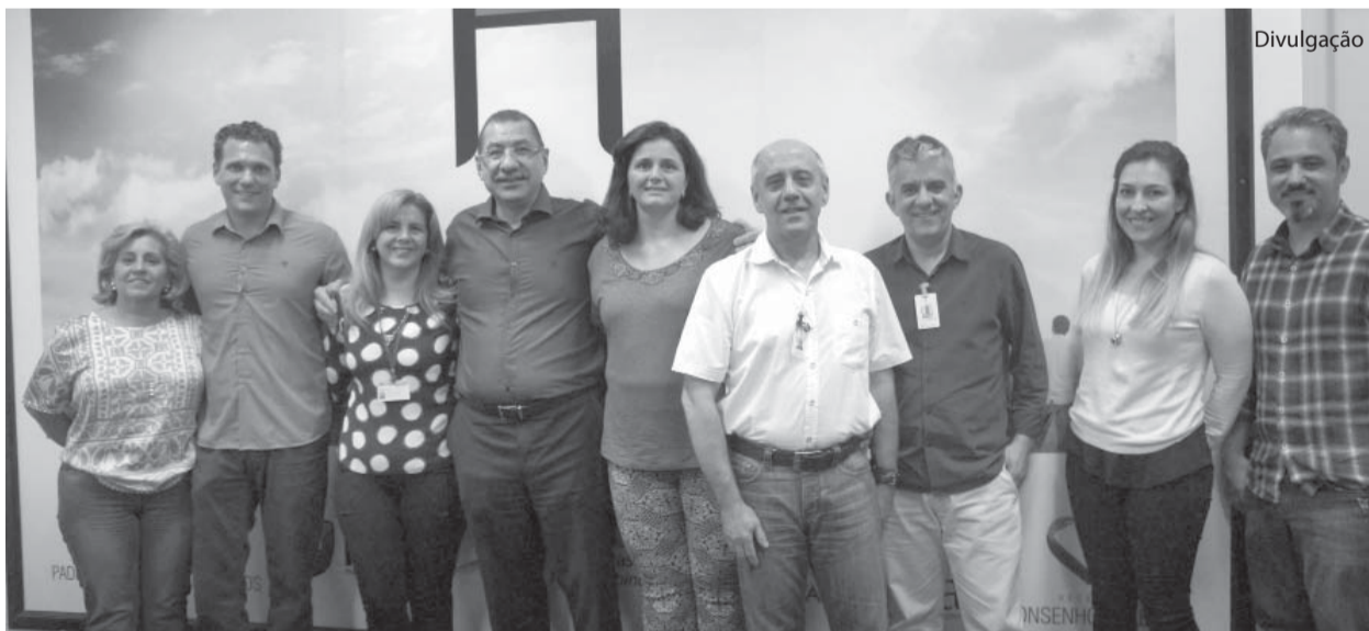
A Comissão após apresentar a programação ao presidente da Diretoria Administrativa.