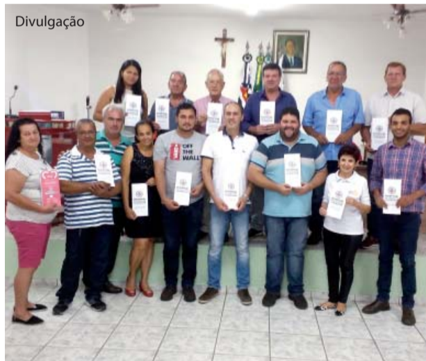
As autoridades foram informadas sobre as mudanças no atendimento oncológico na região.