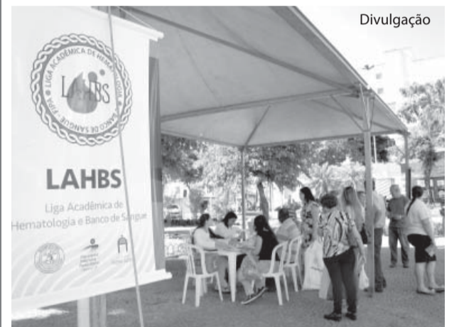
Os alunos também fizeram cadastro de doadores de sangue.