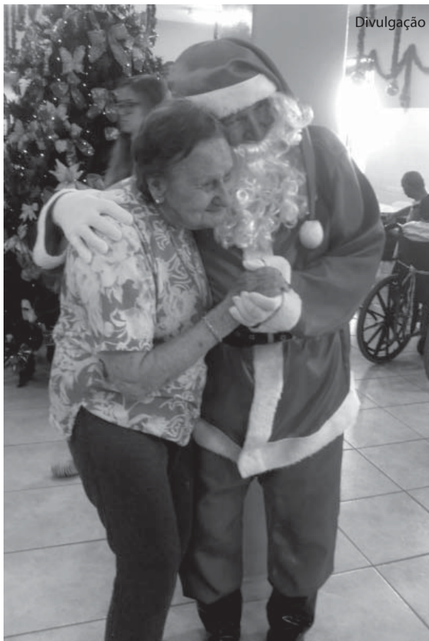
O Papai Noel entregou os presentes para os idosos.

Mantido pela Fundação Padre Albino, o Recanto Monsenhor Albino fica na Rodovia Dr. Alberto Lahóz de Carvalho, s/nº, estrada Catanduva a Novais, fone 17 – 3522-5234.