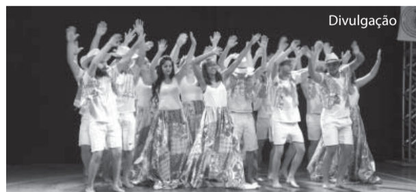
Os alunos aplicaram o que aprenderam nos cursos.

A plateia, que lotou o ginásio de esportes, vibrou a cada apresentação. Em cada coreografia uma surpresa que encantou os presentes.