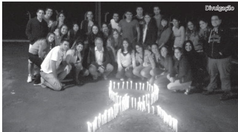
Os alunos acendem velas em memória a todos aqueles que já morreram da doença

liados. Os intercâmbios são tanto na área clínica quanto na área de pesquisas médicas.