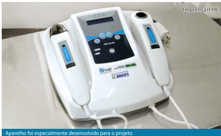
Aparelho foi especialmente desenvolvido para o projeto

Para eles, a colaboração de todos os participantes é que deverá legitimar a técnica, mostrando o valor que ela apresenta para amplo uso. “Fazer isso é uma forma de disseminar estas tecnologias inovadoras de uma forma mais geral, ao invés de restringi-las a alguns poucos locais, preparando assim a comunidade médica nesta área para novos avanços que já estão em desenvolvimento”, ressaltam.