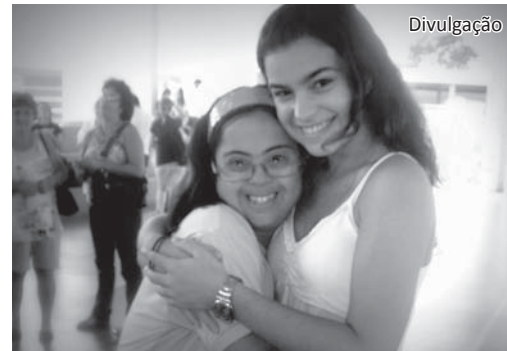
Foto premiada no concurso da IFMSA Brazil

A foto da Campanha do Dia Internacional da Síndrome de Down realizada pela IFMSA de Catanduva dia 22 de março último foi premiada com o 3º lugar no concurso da IFMSA-Brazil.