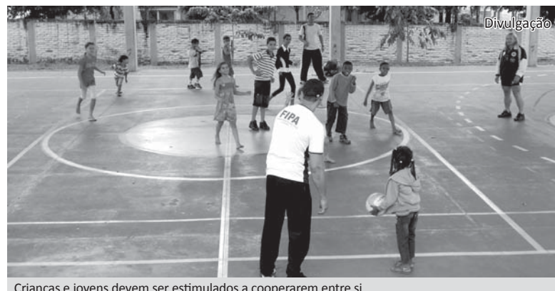
Crianças e jovens devem ser estimulados a cooperarem entre si