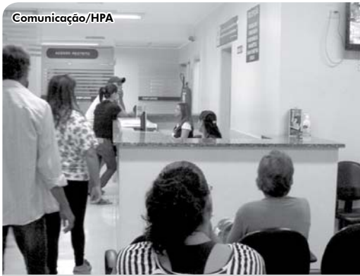
O Centro de Diagnóstico por Imagem fez mais de 130 mil exames em 2013.

Os hospitais Padre Albino e Emílio Carlos atenderam 158.375 pacientes em 2013, entre internações, atendimentos ambulatoriais e de urgência e emergência.