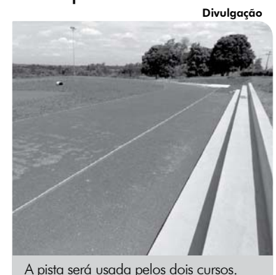
A pista será usada pelos dois cursos.

Construída com estrutura pedagógica, contendo caixa de salto e área de arremesso, ela será utilizada pela disciplina de Atletismo nos cursos de Licenciatura e Bacharelado já neste ano de 2014.