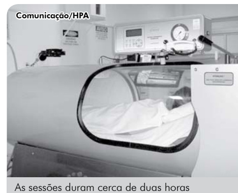
As sessões duram cerca de duas horas

O Serviço de Medicina Hiperbárica da Fundação Padre Albino, instalado no Hospital Emílio Carlos desde 2011, conta com uma câmara monoplace (monopaciente) da marca ECOTEC que tem auxiliado no tratamento das feridas dos pacientes internados e dos demais clientes referenciados à Unidade.