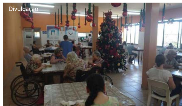
Em 2018 a campanha beneficiou idosos.