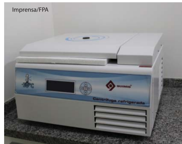
A centrífuga refrigerada é o destaque dos equipamentos adquiridos.

Em uma das situações, o estudo envolveu uma criança do sexo feminino, com oito meses de idade, vítima de queimadura em face incluindo pálpebras, dorso nasal