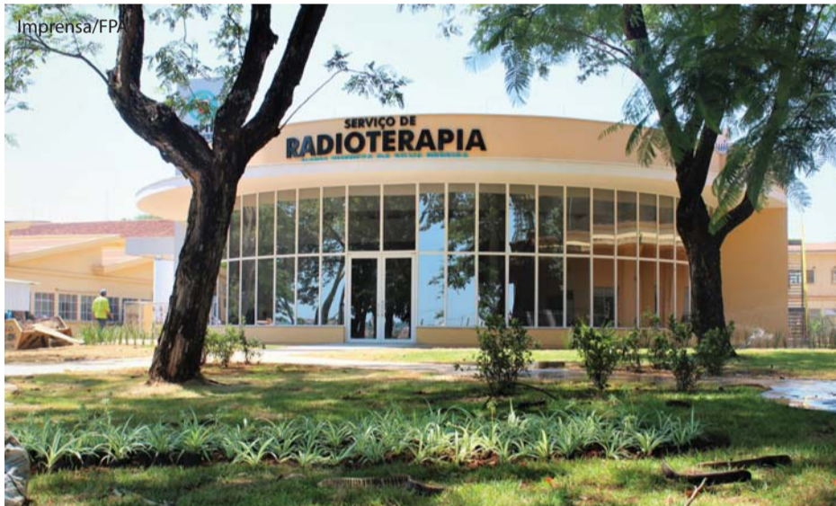
O paisagismo também está sendo finalizado.

Nas três primeiras semanas de janeiro funcionários trabalharam na montagem do mobiliário, arquivo deslizante, sistema de informática e ajustes no prédio do Serviço de Radioterapia/Hospital de Câncer de Catanduva/HCC. Última página.