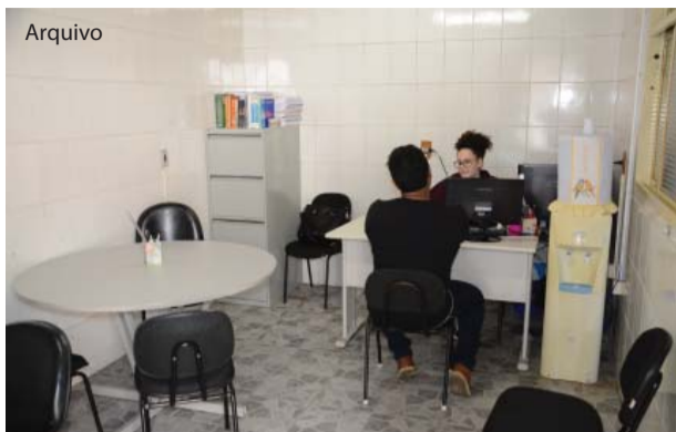
O atendimento é gratuito.

O curso de Direito da UNIFIPA, através do escritório jurídico do CEPRAJUR – Centro de Prática Jurídica, realizou no ano de 2018 mais de 320 atendimentos jurídicos à população carente. O projeto de assistência gratuita oferece práticas jurídicas aos seus alunos, por meio de atendimentos à comunidade, promovendo a solução de conflitos e orientação de direitos e obrigações aos que procuram o serviço.