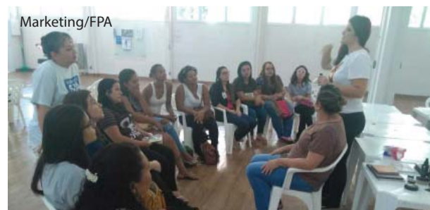
No workshop foram trabalhados vários sentidos.

No treinamento, o Núcleo visou trabalhar os sentidos de comunicação, postura, etiqueta e imagem profissional dos colaboradores das portarias, recepção, copa, enfermagem e auxiliares administrativos. Os participantes ainda contaram com oficina de corte de cabelo e auto maquiagem, através de parceria com o Instituto Embelleze, e receberam kits de beleza e cuidados pessoais.