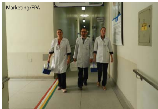
As 141 entrevistas de 2018 resultaram em 87 doações de órgãos.

A Comissão Intra-Hospitalar de Transplante (CIHT) da Fundação Padre Albino colocou Catanduva entre as três principais cidades do Noroeste Paulista que realizam captações de córneas e múltiplos órgãos. A CIHT promove o acolhimento e a abordagem com os familiares nos hospitais Emílio Carlos (HEC) e Padre Albino (HPA). A informação é da Organização de Procura de Órgãos (OPO), de São José do Rio Preto.