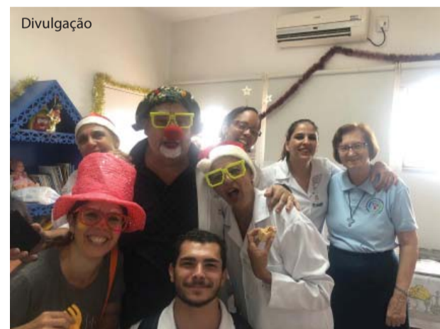
Os promotores da festa.

Após a festa, os integrantes do Dr. Sara & Cura se apresentaram para as crianças da Unidade de Tratamento de Queimados (UTQ).