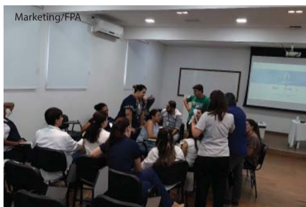
Os grupos fizeram balanço de 2018 e definiram diretrizes para 2019.

No encontro foram avaliadas as ações positivas do ano, a ampliação do número de participantes no GHT, o fortalecimento do conceito "Juntos pela humanização na Saúde", o selo Amigo do Idoso, as melhorias na ambiência e acolhimento, dentre outras atividades. Durante a reunião, os coordenadores dos CIHs utilizaram a metodologia ativa para proporcionar maior interação entre todos os participantes. Após o levantamento dos pontos fortes e da necessidade de melhorias, os profissionais vão desenvolver ações que integram o planejamento estratégico da instituição. De acordo com o setor, a humanização tem como objetivo intervir na melhoria dos processos de trabalho e na qualidade da produção da saúde.