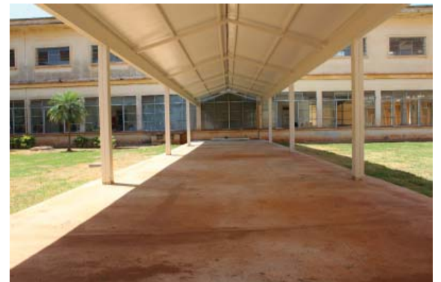
Interligação entre a Radioterapia/Hospital Emílio Carlos.