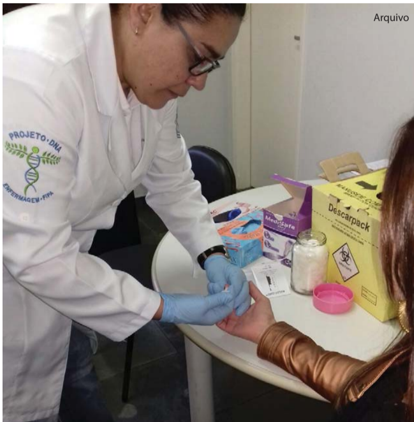
O curso de Enfermagem é responsável pela coleta do material biológico.

Com mais de 60 famílias atendidas em 2018, o projeto “Investigação de paternidade por meio da coleta descentralizada de DNA” promoveu a conclusão, com rapidez, de dezenas de processos de investigação de paternidade na Comarca de Catanduva. O projeto, promovido há três anos pelo Fórum de Catanduva, em parceria com os cursos de Enfermagem e Direito da UNIFIPA