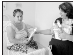
Pacientes do “Emílio Carlos” ganham um mimo.