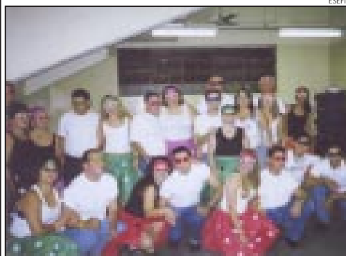
Integrantes do projeto participaram do Festival de Dança da Esefic.

A Escola Superior de Educação Física e Desportos de Catanduva (ESEFIC) está com inscrições abertas para o Projeto “DV de bem com a vida”, destinado a pessoas com deficiência visual de Catanduva e região. As aulas são gratuitas. Página 11.