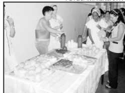
Café homenageia funcionárias do “Emílio Carlos” no seu dia.