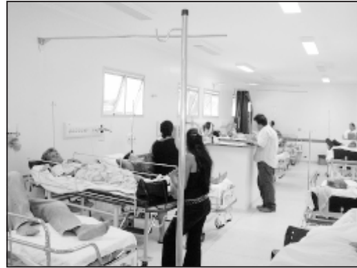
Sala de Observação da Unidade de Urgência e Emergência.

“A procura diretamente na Unidade de Urgência e Emergência pode ser realizada quando, em situação de gravidade, o SAMU não puder ser acionado”, explica