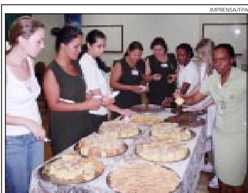
HOMENAGEM Funcionárias do Hospital Padre Albino participam de um café oferecido em comemoração ao Dia Internacional da Mulher. Página 11.