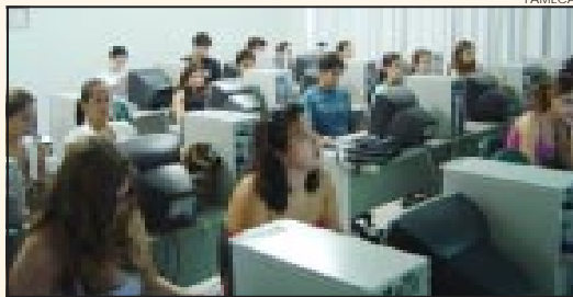
36 alunos fizeram este primeiro curso.