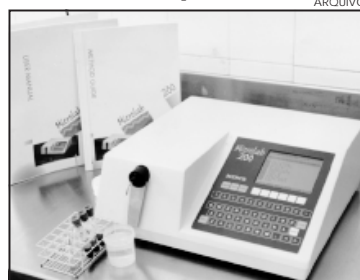
Equipamento para laboratório de análises adquirido com recursos da campanha: garantia de qualidade de serviços.